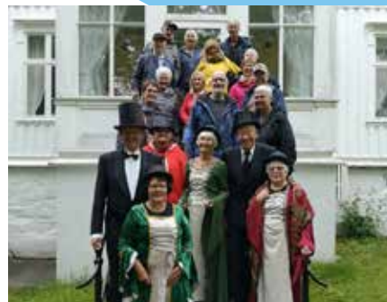
Telepensjonistene, staselig utkledd i tidsriktige klær, fikk høre om livet på Tjøtta gård under fire generasjoner Brodtkorb.

Dagen begynte med en kopp rykende varmt drikke på sengen før frokost med tilhørende madeira, portvin og øl. Musikere underholdt under det overdådige middagsmåltidet, og senere til dans. Iblandt var det forestilling i teatersalen.