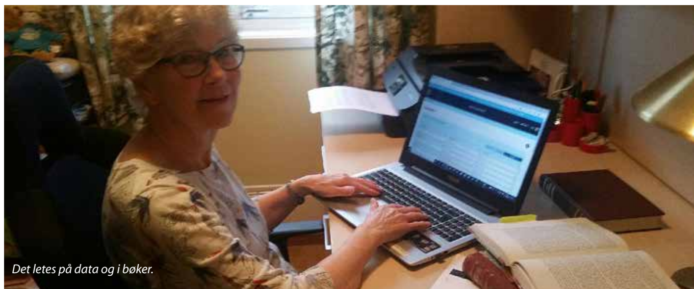
Det letes på data og i bøker.

Slektsforskning har vært og er en utrolig spennende og givende hobby for meg! Jeg fortsetter!!