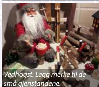
Vedhøgst. Legg merke til de små gjenstandene.