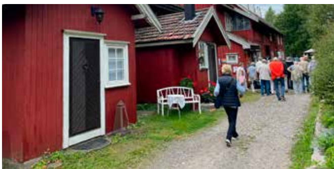
De sjarmerende boligene i Bråtågata var tidligere hjemmene for jernverkets arbeidere.

Midgard vikingsenter på Borre i Vestfold var første stopp da 31 telepensjonister fra Fornebu dro på august-tur. Borre nasjonalpark med gravhauger fra yngre jernalder har flere skipsgraver, kammegraver og flatgraver. Bare en av storhaugene er full-